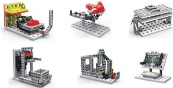
Kit de construcción de pruebas de competencia para entrenamiento