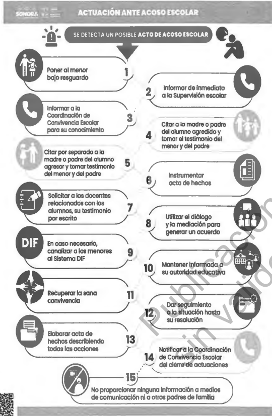
Anexo 3. Diagramas de flujo